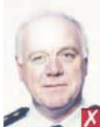
Отражение вспышки на коже