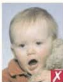
Рот открыт и игрушка слишком близко к лицу