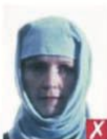
Тень поперек лица