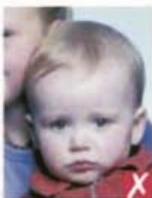
Виден другой человек