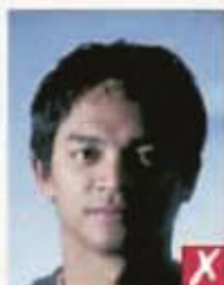
Тени поперек лица