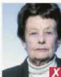
Не по центру