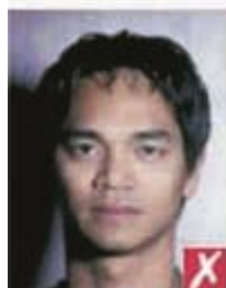
Тени позади головы