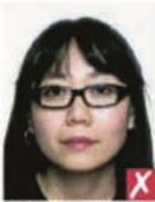
Оправа слишком толстая