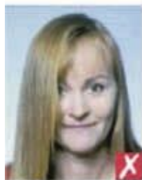
Волосы поперек глаз

- необходимо использовать однородное освещение: на фотографии не должно быть теней и отражения вспышки на лице, не должно быть эффекта красных глаз.