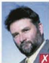
Глаза под наклоном