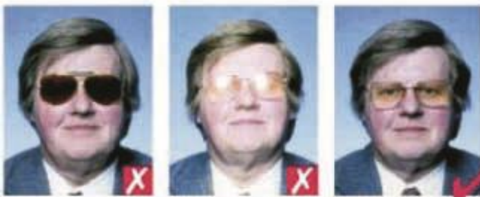
Темные окрашенные линзы

- на фотографии должен быть изображен только один индивид (не должно быть изображений спинки стула, игрушек, других индивидов), смотрящий прямо в камеру с нейтральным выражением лица и закрытым ртом.