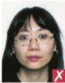
Оправа закрывает глаза