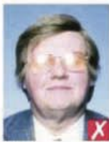
Отражение вспышки на линзах